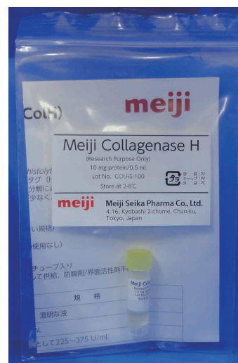
Meiji Collagenase H (ColH)