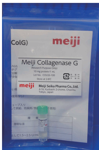
Meiji Collagenase G (ColG)