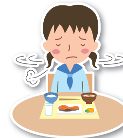
しょくよく た 食欲がなく食べられない