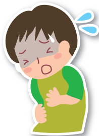
げり おうと 下痢や嘔吐