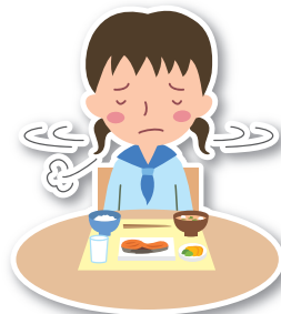
しょくよく た 食欲がなく食べられない