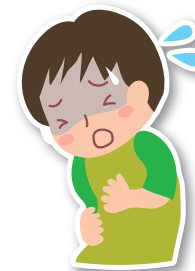
げり おうと 下痢や嘔吐