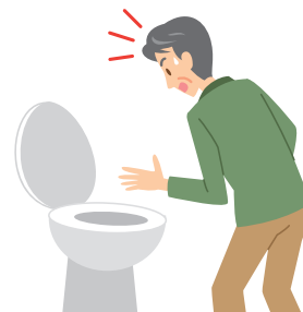
消化管からの出血 (便の色が黒っぽくなる)

これらの症状に気がつきましたら、お薬が原因かご自身で判断せず、医師に相談してください。ご自身の判断でこのお薬の服用をやめたり、飲む回数を減らしたりしないでください。