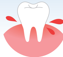
歯ぐきからの出血