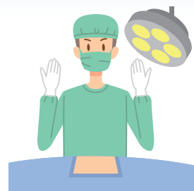
外科手術を受ける時