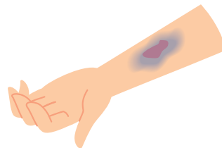
皮下出血(あおあざ)