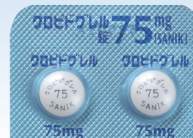
クロピドグレル錠75mg「SANIK」