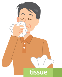
鼻をかむときは、 力まず、やさしく