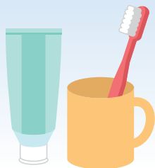
歯ブラシは柔らかめのものを