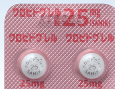
クロピドグレル錠25mg「SANIK」