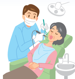
歯の治療を受ける時