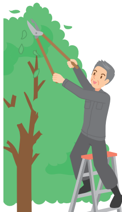
けがの恐れがある 仕事や運動は なるべく避けましょう