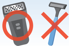
ヒゲ剃りは電気カミソリで

血が止まりにくくなることがあるので、出血しないよう、下記のような点に注意してください。