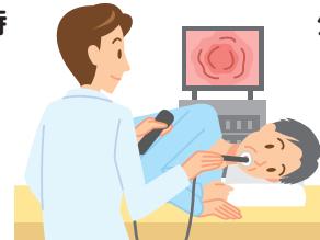
内視鏡検査を受ける時

他の診療科や病院・診療所を受診する時には、医師に抗血小板薬を服用していることを必ず伝えてください。 もし、その医師から抗血小板薬の服用を中止するよう指示が出た時には、抗血小板薬を処方した医師に相談してください。