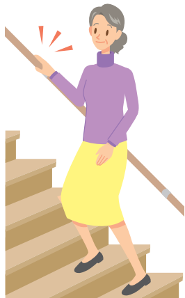
転倒に注意しましょう