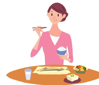
骨の形成に必要な栄養素と食品

アナストロゾール錠1mg「明治」などのアロマターゼ阻害薬は、長期的に服用すると骨粗しょう症 こつそしょうじょう になりやすいといわれています。骨折を予防するために、骨の原料となるカルシウムや、骨の形成にかかわるビタミンD、ビタミンKを多く含む食品を積極的にとることをおすすめします。