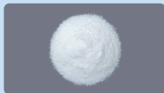
レベチラセタム ドライシロップ50%「明治」

服用直前に混ぜてください。 つくり置きはせず、服用ごとに1回分 をつくるようにしてください。