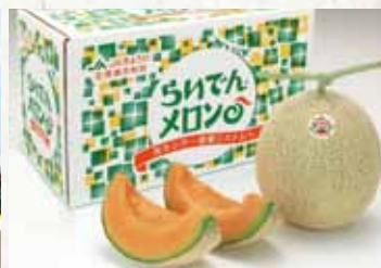
全国に出荷される「らいでんメロン」 ◀ 農林水産大臣賞受賞 ▶