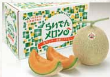
全国に出荷される「らいでんメロン」 ◀ 農林水産大臣賞受賞 ▶