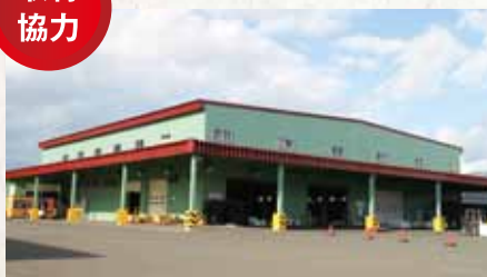
共和町メロン集出荷選果施設

〒045-0122 北海道岩内郡共和町発足190 TEL 0135-74-3011 http://www.ja-kyouwa.jp/